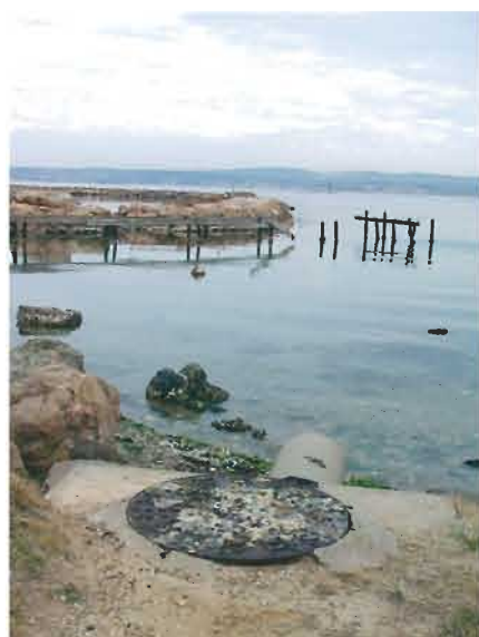
Déversement d'un trop plein de réseau d'assainissement dans le quartier du Barrou à Sète.

Qu'arrive-t-il alors lorsque les rejets des activités économiques (industrielles et artisanales) sont raccordés de façon incontrôlée au réseau d'assainissement collectif ?