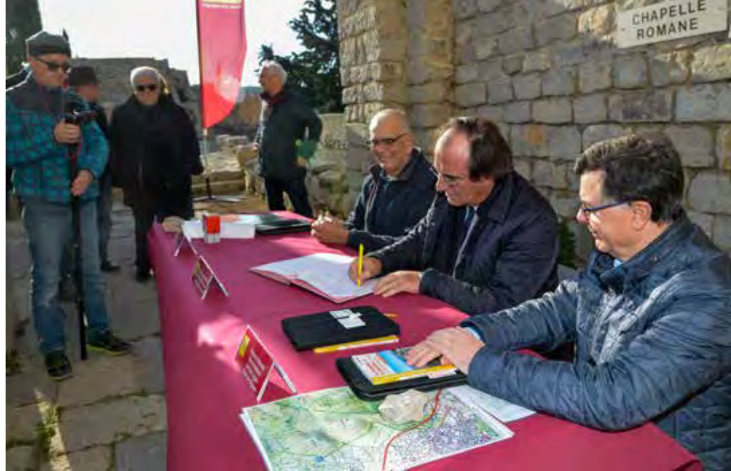
Dévoilement du premier panneau d'information et signature de la charte sur le parvis de l'abbaye Saint Félix de Montceau.