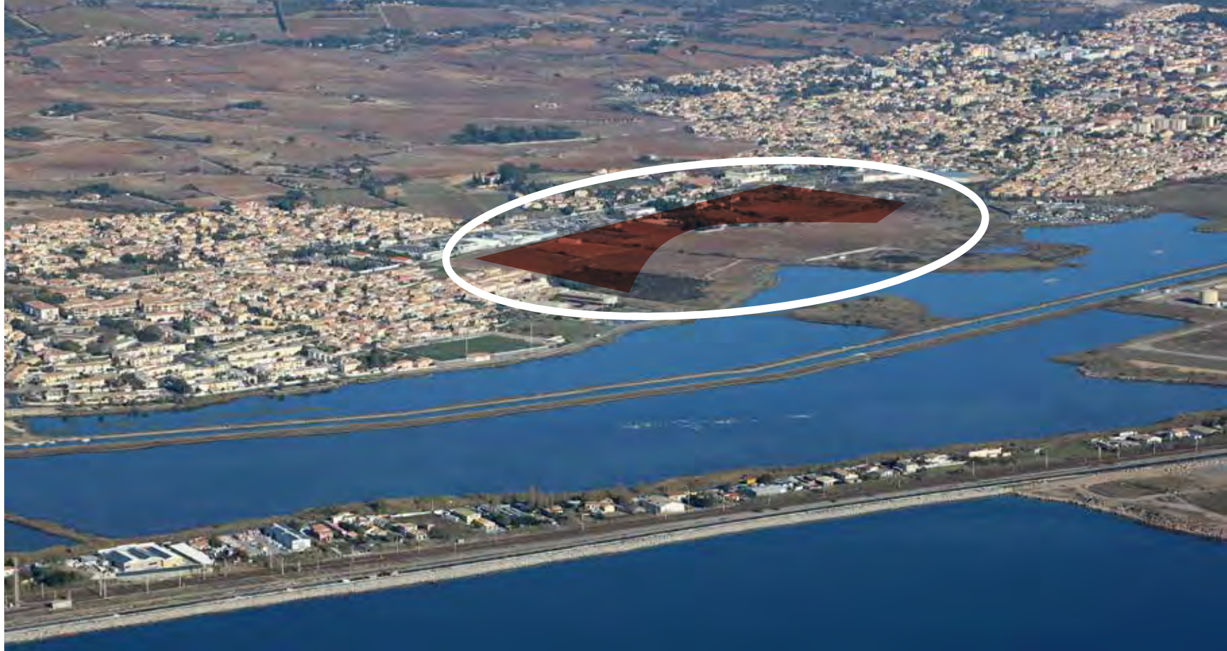
Les Hierles ou le projet d'un quartier résidentiel adossé à un parc urbain.